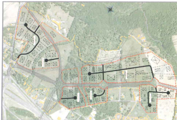
Variante 1 (issue du dossier volet milieux naturels page 148)

Concernant l'aménagement du secteur, trois variantes ont été étudiées. La variante 1 a été retenue compte tenu du fait qu'elle propose des tailles de parcelles plus petites et mieux adaptées aux types d'entreprises susceptibles de s'implanter sur la zone (activités artisanales, entreprises de petites tailles...), et qu'elle propose une plus grande fluidité de circulation au sein du parc d'activités avec un nombre limité d'accès directs aux parcelles depuis la VLN. L'insertion paysagère est présentée comme un critère de sélection mais cela est réduit à la taille (modeste) des parcelles et des futurs bâtiments qui y seront implantés.