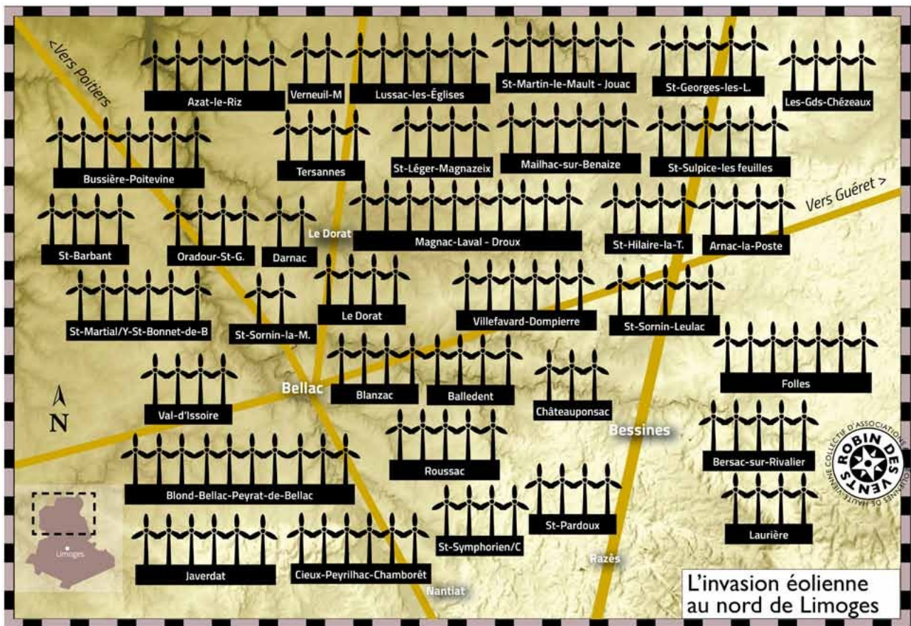
Illustration 1: Carte des projets éoliens – Nord de la Haute-Vienne – Juillet 2019

Sur ce petit territoire (environ 1.600 km 2 ), ce sont déjà 176 mâts de 180m et plus qui se profilent ; et encore n'est-ce là que la première vague de cette destruction méthodique et programmée de ce territoire. Car vous n'êtes pas sans savoir que cette première vague sera suivie d'une deuxième, puis d'une troisième, sans doute d'une quatrième ... Ad nauseam ... Triste certitude que nous enseigne l'histoire actuelle de la Vienne, de la Charente, de la Charente-Maritime, de l'Indre ... L'appétit des prédateurs éoliens pour l'argent facilement gagné ne sera jamais satisfait, quel qu'en soit les conséquences.