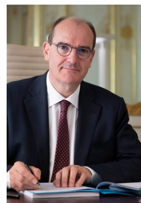
Jean CASTEX Premier Ministre

Nous avons conscience que nous sommes à une époque charnière de notre histoire industrielle, comme toujours, ces moments sont passionnants quand ils sont au croisement de ce que le volontarisme politique auquel je suis particulièrement attaché et le génie français, dont je ne cesse d'être admiratif, sont capables de faire de mieux. Une fois encore, croyez-moi, si elle s'en donne les moyens, la France saura inventer des solutions. »