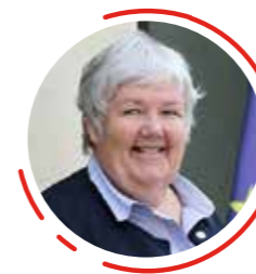
Jacqueline Gourault Ministre de la Cohésion des territoires et des Relations avec les collectivités territoriales