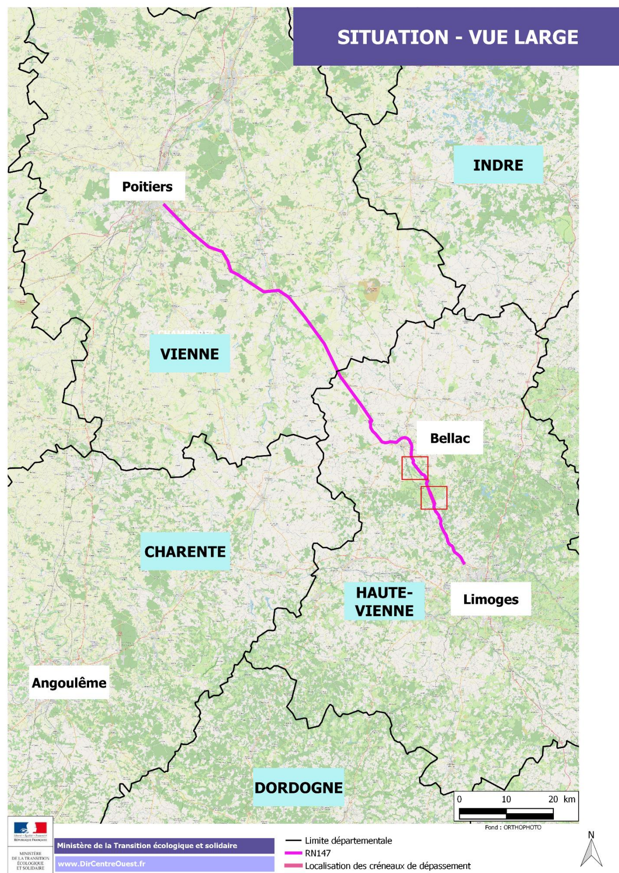
Figure 1 : Situation par rapport aux grands pôles d'attractivité de la Nouvelle-Aquitaine