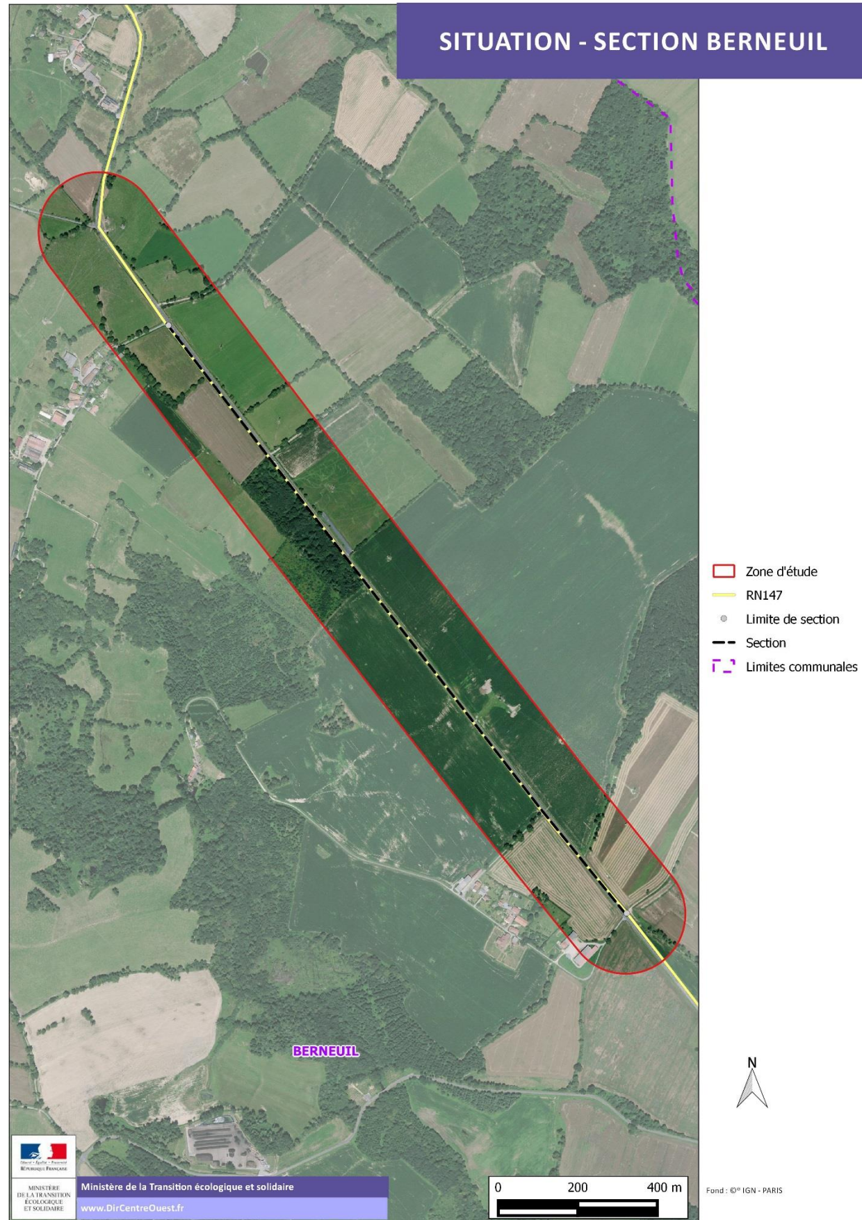
Figure 3 : Zoom sur le secteur de Berneuil