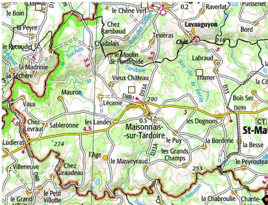
Illustration 1:

Le territoire communal compte trois zones naturelles d'intérêt écologique, faunistique et floristique (ZNIEFF) sur les vallées de la Tardoire, du Nauzon et du Trioux. Il est caractérisé par une forte fragilité des cours d'eau et de leurs usages (périmètre de protection des prises d'eau de la Séchère et du Moulin de Chaladais), classement du bassin versant de la Charente Amont en zone sensible à l'eutrophisation, mauvais état chimique des masses d'eau souterraines, dégradation du potentiel piscicole.