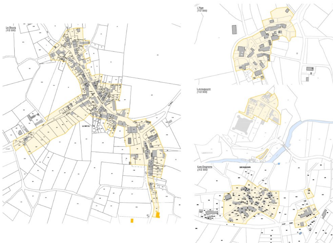
Illustration 2: Plan de zonage d'assainissement de Maisonnais-sur-Tardoire (dossier d'évaluation environnementale)

Le zonage d'assainissement de la commune de Maisonnais-sur-Tardoire a été soumis à évaluation environnementale après examen au cas par cas, en application de l'article R. 122-17 du Code de l'environnement 1 .