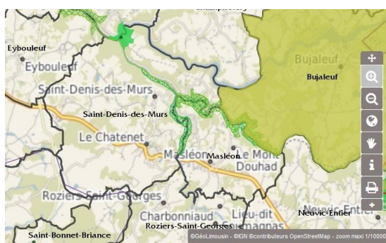
Localisation de la zone Natura 2000

Le territoire communal intersecte le site Natura 2000 (FR7401148) « Haute vallée de la Vienne », site qui fait l'objet d'un projet d'extension depuis 2009, pris en compte par le présent plan. À ce titre, l'élaboration du plan local d'urbanisme fait l'objet d'une procédure d'évaluation environnementale, en application des articles L. 104-1 et suivants du Code de l'urbanisme.