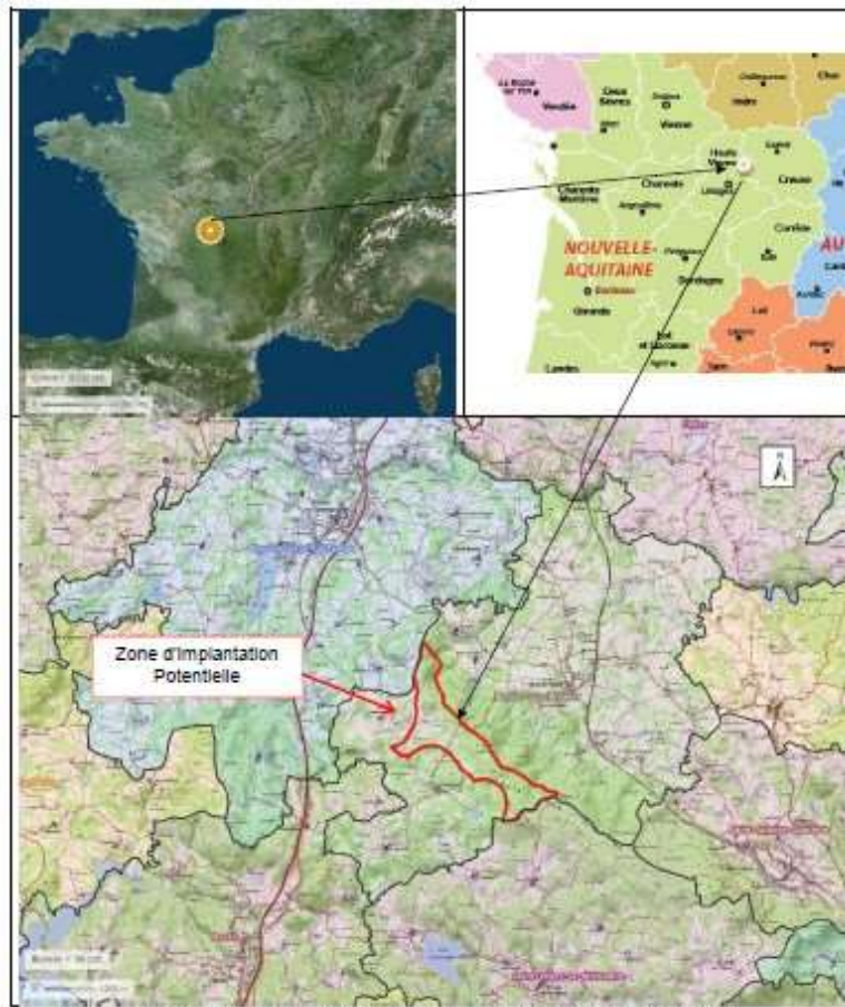
Figure 8 : Localisation du projet dans son contexte géographique national, régional et local

Le projet porte sur la création d'un parc éolien sur la commune de Bersac-sur-Rivalier.