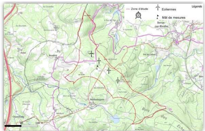
Extrait du dossier 2019 (figure 36 page 21 note non technique)