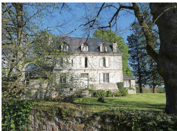
Château de Villefavard