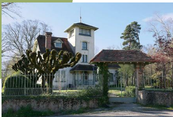
Villa La Solitude