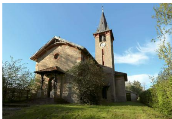
Temple de Villefavard