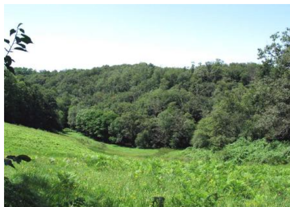
Vallon en amont du moulin

l'église ainsi que le carrefour sur lequel donnent les entrées du château et de la ferme permettent de bénéficier d'une vue panoramique et lointaine sur le vallon secondaire verdoyant entrecoupé de haies au premier plan de collines boisées.