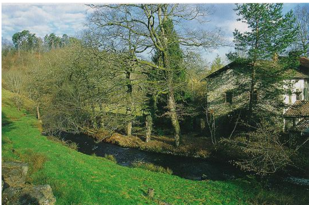
La vallée de la Couze.

La partie aval du site est accessible par le chemin conduisant à une ancienne usine (papeterie puis filature). Le coteau de la rive gauche très abrupt est dominé par des landes. Le chemin d'accès bordé de gros chênes offre un point de vue sur ce site. Les aménagements de la rivière aux abords de l'usine, réalisés en pierre, sont encore bien visibles et participent, avec l'ouverture de la vallée sur les prairies, à une ambiance de jardin.