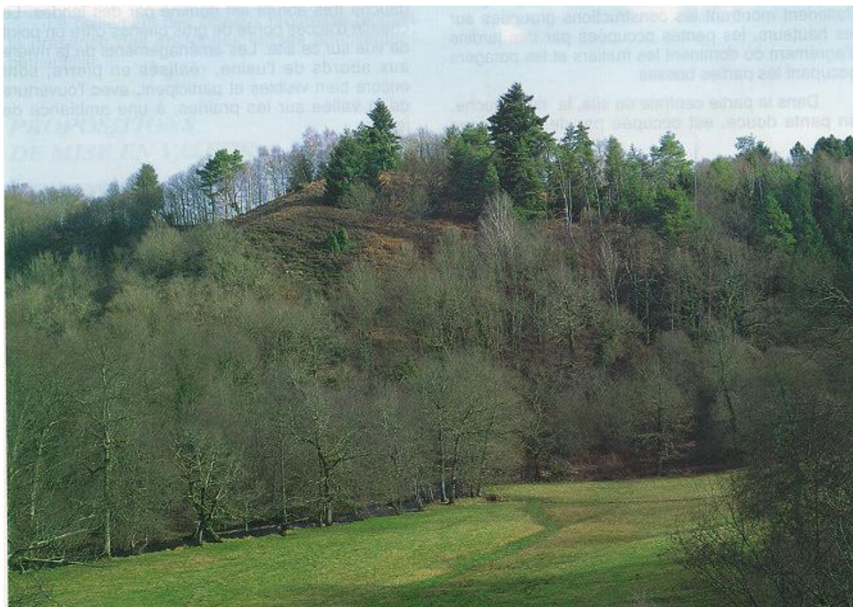
La vallée de la Couze.