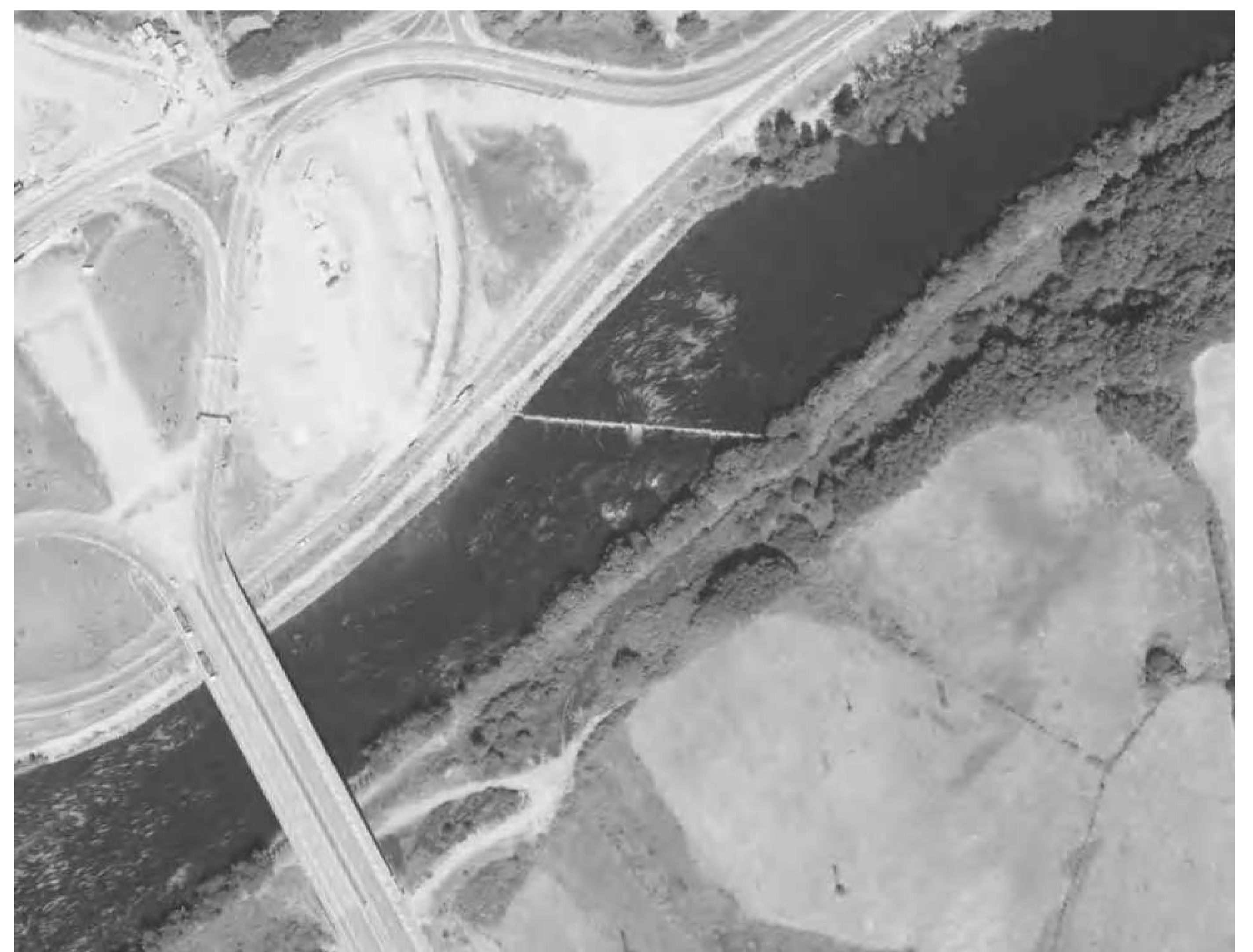
Vue aérienne de 1986 - Travaux de construction l'échangeur des Casseaux (A20)

Longueur : 110 m ; Hauteur maxi : 1,20 m ; Largeur en crête : 0,70 m ; Brèche centrale : 5,00 m ; Linéaire influencé : 620 m en amont Le seuil est constitué de moellons recouverts d'une coque en béton.